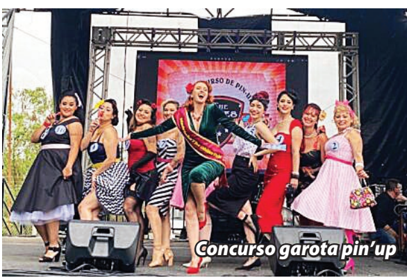
Concurso garota pin'up