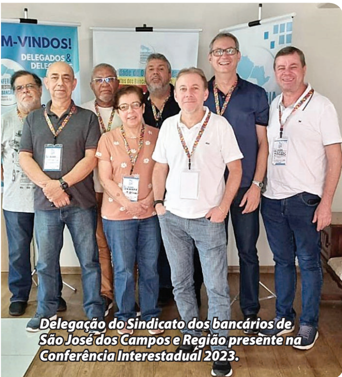
Delegação do Sindicato dos bancários de São José dos Campos e Região presente na Conferência Interestadual 2023.

Os temas debatidos e aprovados em plenária na Conferência Interestadual orientam as discussões da Campanha Nacional dos Bancários, que ocorre a cada dois anos e resultam no Acordo Coletivo de Trabalho. A próxima Campanha Nacional será realizada em 2024.