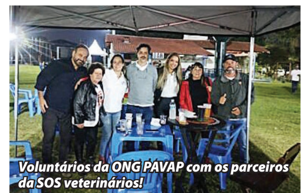
Voluntários da ONG PAVAP com os parceiros da SOS veterinários!